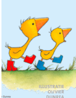
ILLUSTRATIE OLIVIER DUNREA